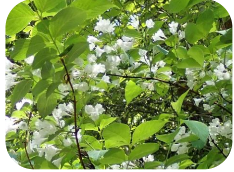
白花のタニウツギ

事前の参加申し込みは必須ではありませんが、名札などの準備の都合上、会員外の方、特に初参加の方はご連絡いただくと幸いです。